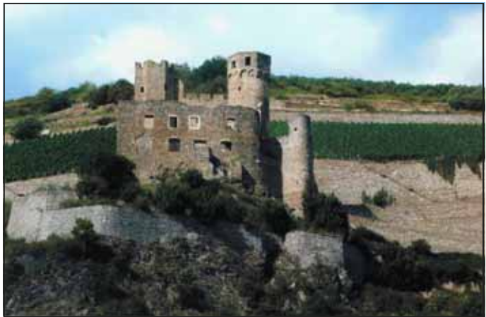
Mitten in Weinbergen gelegene, imposante Burgruinen säumen das Rheintal.