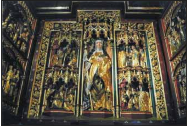
Bildnis von Hildegard von Bingen am Altar der Rochuskapelle in Bingen.

Nach dem Mittagessen war Zeit, einen Spaziergang vorbei an Obstplantagen und einem kleinen Wäldchen zu machen. Am Ende des Plateaus bot sich uns ein herrlicher Ausblick auf die umliegenden Weinberge und das Rheintal, das zum Unesco Welterbe „Oberes Mittelrheintal“ zählt. „Wie ist es am Rhein so schön.“ Diese Liedzeile wurde oft zitiert.