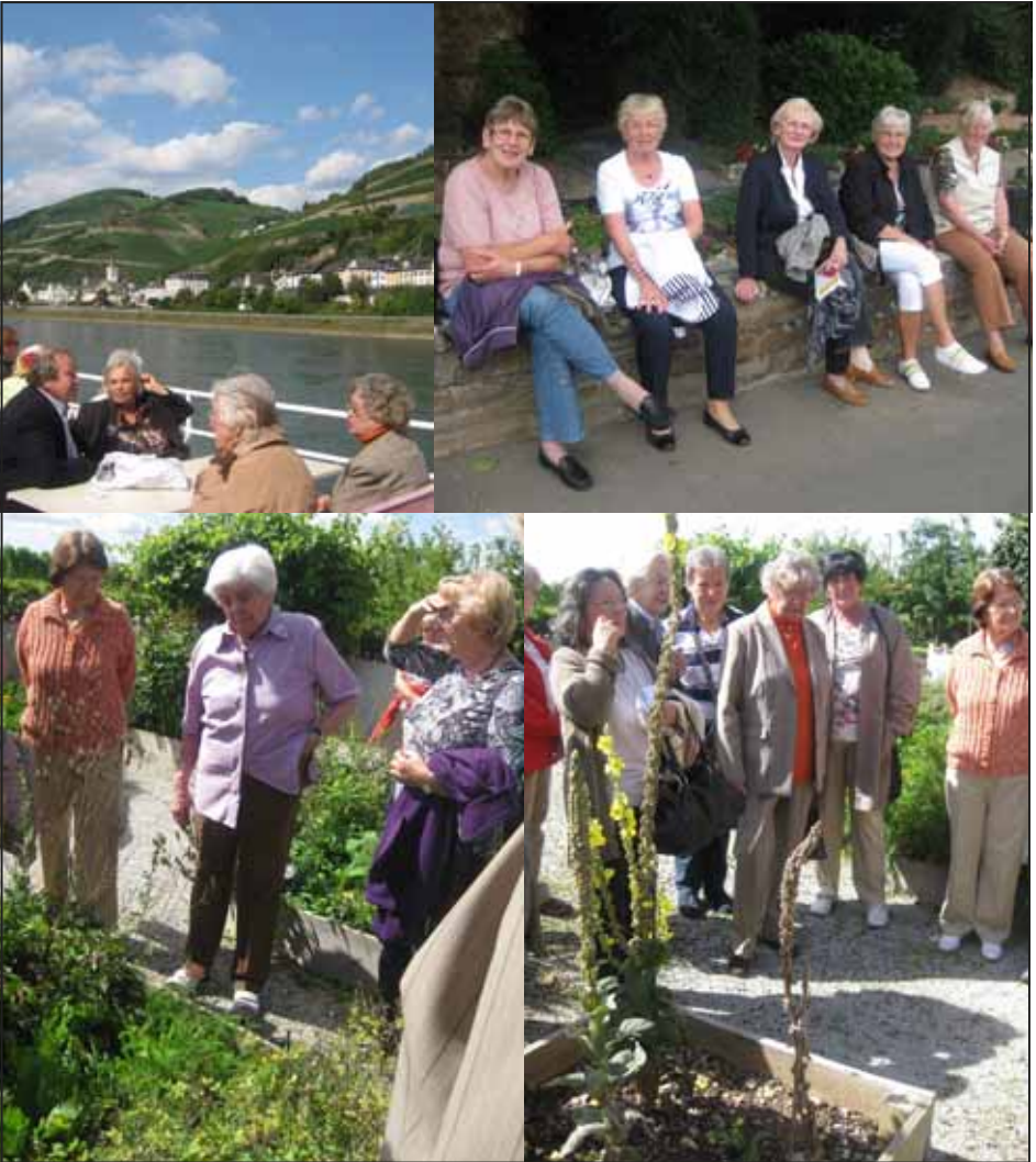
Impressionen vom Jahresausflug 2011 der Frauenhilfe nach Bingen

heiligen Rochus, der auch als Pestheiliger verehrt wird, und legten drei Gelübde ab. Sie wollten den Hausberg nach Rochus benennen, eine Kapelle bauen und jährlich im August, in einer Prozession auf den Berg ziehen,